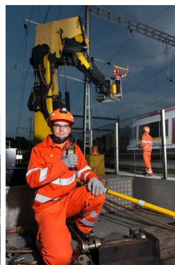
Lignes de contact

Éditée par l'Organe responsable de la formation professionnelle d'électricien/ne de réseau