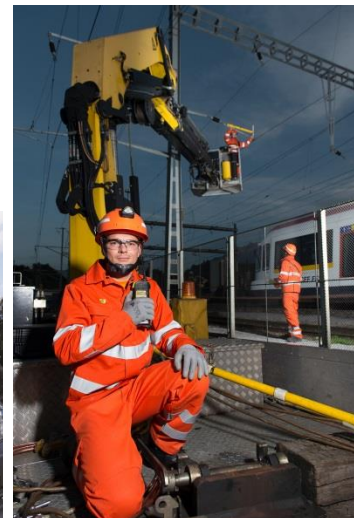
Lignes de contact

Éditée par l'Organe responsable de la formation professionnelle d'électricien/ne de réseau