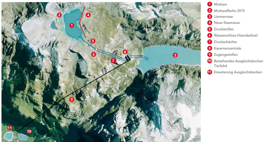
Abbildung 4: Kraftwerke Linth-Limmern.

Das Axpo-Projekt Linthal 2015 besteht im Bau eines unterirdisch angelegten Pumpspeicherwerks, das Wasser aus dem Limmernsee in den 630 m höher gelegenen Muttsee pumpen kann. Damit erhöht sich die Turbinenleistung der Kraftwerke Linth-Limmern von rund 520 MW auf 1520 MW. Im Jahr 2015 konnte die erste Maschinengruppe mit dem Netz synchronisiert werden. Der kommerzielle Betrieb der kompletten Anlage wird im 2018 aufgenommen werden. Die Investitionskosten für dieses Projekt betragen rund 2,1 Mrd. Franken. 5