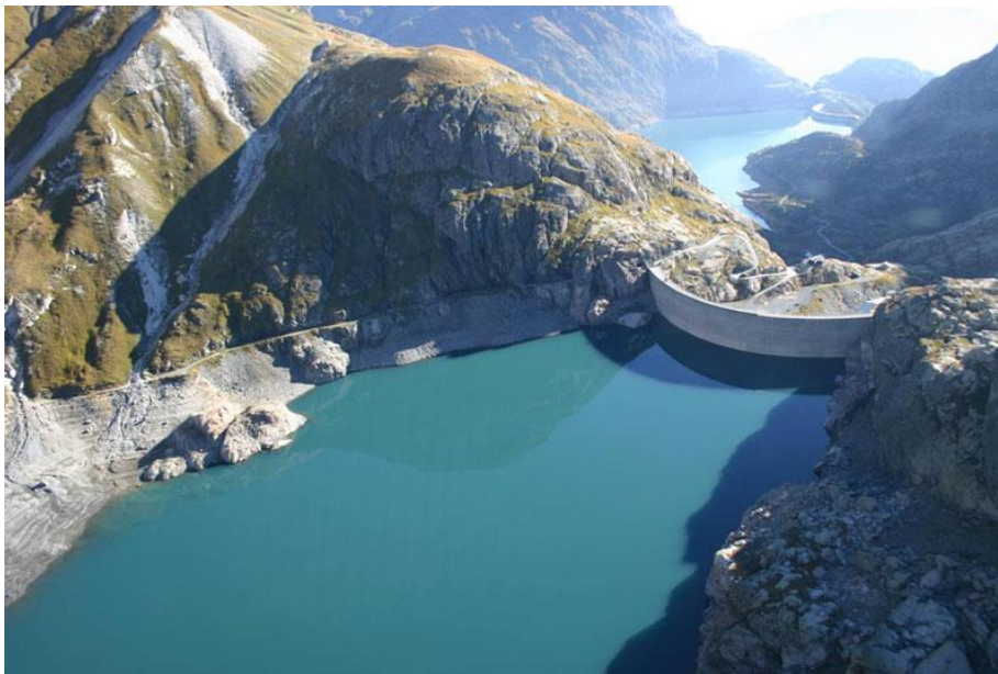
Abbildung 3: Emosson und Vieux Emosson.

Das Pumpspeicherkraftwerk Nant de Drance liegt im Kanton Wallis auf dem Gebiet der Gemeinde Finhaut zwischen Martigny und Chamonix. Nant de Drance nutzt das Gefälle zwischen den Stauseen Vieux Emosson (2225 m ü. M.) und Emosson (1930 m ü. M.), um Energie zu produzieren. Es ist mit sechs Turbinen von je 150 MW auf 900 MW Turbinen- und Pumpleistung ausgelegt und produziert jährlich rund 2500 Mio. kWh (2,5 TWh) mit einem Zyklus-Wirkungsgrad von mehr als 80 % (d.h. einen Pumpenergie-Verbrauch von rund 3100 Mio. kWh haben).